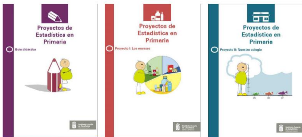
Figura 2. Proyectos de Estadística en Primaria (ISTAC)