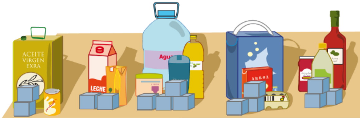
Figura 1. Material del Proyecto “Los Envases” (ISTAC)