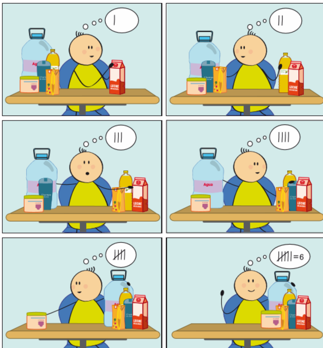
Figura 3. Recuento de elementos que hay en cada grupo (ISTAC)

Nota: el informe debe incluir imágenes reproducidas de los Proyectos “Los Envases” y “Nuestro Colegio” y de la “Guía Didáctica”.