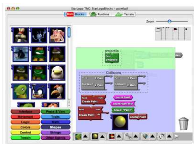
Figura 5. StarLogo

PiktoMir [49] es un entorno de programación gráfico que permite a los niños programar el comportamiento de un robot virtual usando pictogramas. Con ello los niños aprenden los conceptos fundamentales de programación. La herramienta está orientada principalmente a preescolares.