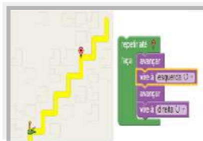
Figura 6. Blockly

Es de resaltar que Blockly [41] (Figura 6) está orientada principalmente a niños e incluye rompecabezas, puzzles, laberintos y juegos a nivel infantil para su interacción, lo cual resulta muy útil para los niños con síndrome de Down, ya que se trabaja con movimientos sencillos de aprender y manejar los conceptos más básicos de programación.