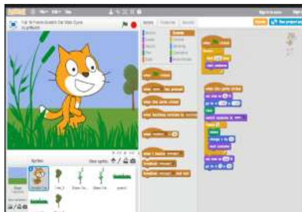
Figura 1. Scratch

En la figura 1 se muestra la interfaz grafica de usuario de Scratch. Esta herramienta es una de las más utilizadas en el aprendizaje de la programación visual en niños. Posibilita el análisis de diferentes soluciones lógicas y algorítmicas, estructurando el pensamiento de las personas que se están iniciando en el mundo de la programación. Para los usuarios resulta bastante fácil personalizar sus proyectos de Scratch con archivos multimedia. Se destaca lo creativo, e intuitivo que es su uso.