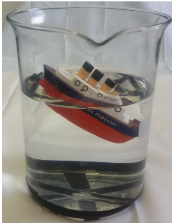
Figura 1 b): El Titanic hundiéndose (Tubtanic [4]), experimento preparado por Franco Bagnoli, de la serie "Fisica di tutti i giorni".