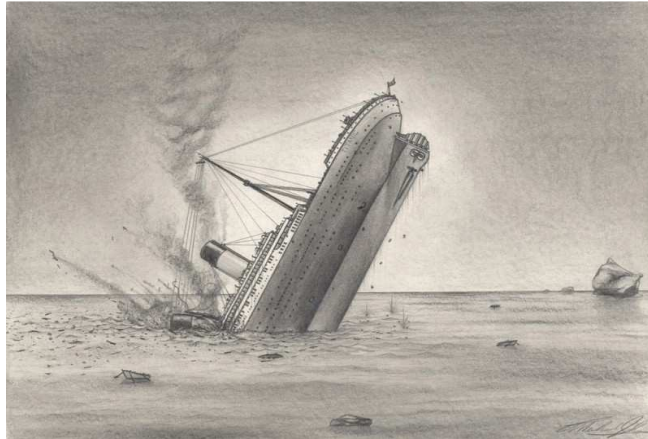
Figura 1 a): Dibujo del Titanic hundiéndose, fuente http://www.mediashow.ro/339380 .