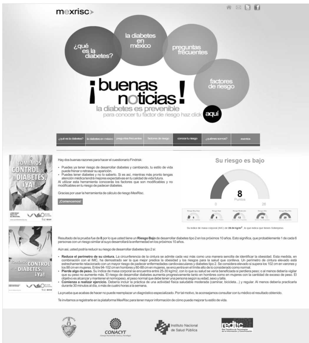
Figura 2. El cuestionario de auto-acceso de factores de riesgo permite obtener los resultados inmediatos. Con los resultados el usuario tiene también una serie de consejos para reducir y/o

La experiencia, para valorar el uso potencial de la plataforma web MexRisc, para estimar el riesgo de diabetes tipo 2 se hizo en dos tiempos; en el primero se organizó una campaña de prevención de diabetes en la Facultad de Ciencias de la Computación de la Benemérita Universidad Autónoma de Puebla y se invitó a la comunidad a visitar la plataforma y contestar el cuestionario FindRisk mediante auto-acceso.