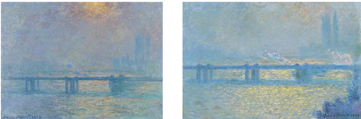
Figura 2. “Charing Cross Bridge, the Thames” (1899) e “Charing Cross Bridge (Overcast Day)” (1900), por Claude Monet (Tate, 2011)

Os naturalistas, por sua vez, acreditam na possibilidade de acesso à natureza de modo objetivo. Na pintura, os artistas buscavam certas características que poderiam ser instantaneamente percebidas em seu trabalho. Um exemplo de estilo de pintura naturalista é o Impressionismo. A meta de alguns impressionistas era manter em suas pinturas a luminosidade instantaneamente percebida. Esse é o motivo para as pinceladas rápidas e aparentemente descuidadas. Eles necessitavam fazê-las o mais rápido que pudessem, uma vez que a luminosidade inevitavelmente mudaria. A busca era pela luz, não pela forma. Assim, sequências de paisagens pintadas em diferentes momentos eram bastante comuns, uma vez que a luz é diferente em cada pintura. Um exemplo de tal sequência de pinturas é “A Ponte de Charing Cross” (Figura 2), pintada por Claude Monet em 1899: